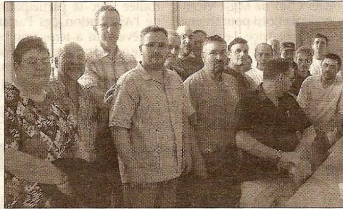
Les membres de l'Assemblée Générale

► Dernièrement, Vital Services tenait son assemblée générale en mairie. L'occasion pour cette association de faire le point sur les divers services qu'elle propose à la population tout en employant des personnes en situation de réinsertion. Se côtoient dans les tâches que s'est données l'association le portage de repas à domicile dans les villes et villages du Maubeugeois (un service qui monte en puissance), l'aménagement environnemental, mais aussi – et c'est là quelque chose d'unique en Val de Sambre – un certain nombre de services d'aide à la mobilité : une centrale d'information qui renseigne sur les horaires des transports en commun (trains et bus), la mise en place d'un réseau de « transport occasionnel » qui permet de pallier les insuffisances (en lignes ou en horaires) des autobus (l'association emploie deux chauffeurs, possède une Kangoo, va acheter un second véhicule et peut-être même un troisième). On notera encore l'organisation du co-voiturage pour mettre en relation des personnes qui font les mêmes trajets, qu'elles aient ou non un véhicule.